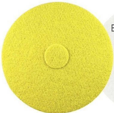
BONASTRE PADS 2