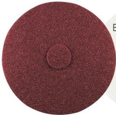
BONASTRE PADS 1

Premier système de polissage en 3 étapes.